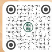
招生小红书二维码