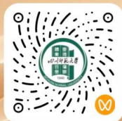
招生视频号二维码