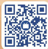
招生哔哩哔哩二维码