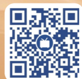
招生哔哩哔哩二维码