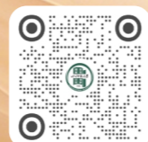
招生小红书二维码